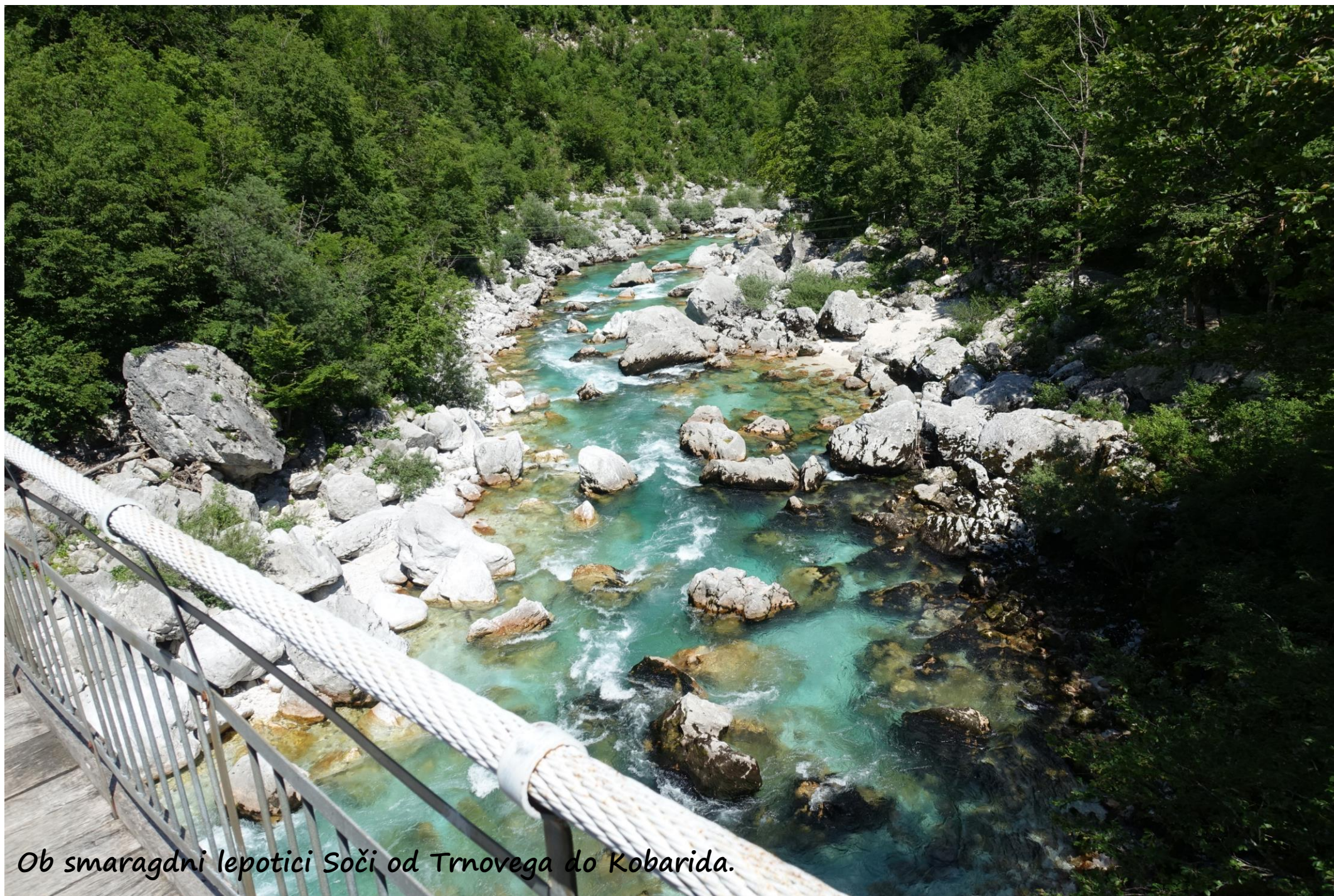
Ob smaragdni lepotici Soči od Trnovega do Kobarida.