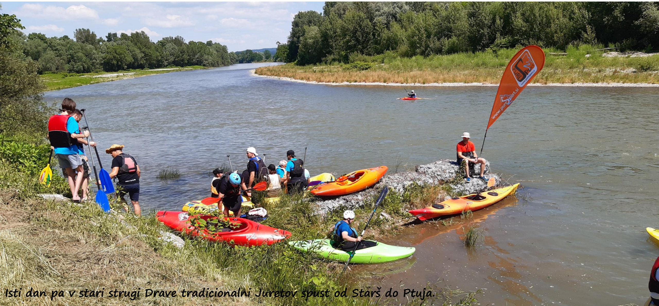
Isti dan pa v stari strugi Drave tradicionalni Juretov spust od Starš do Ptuja.