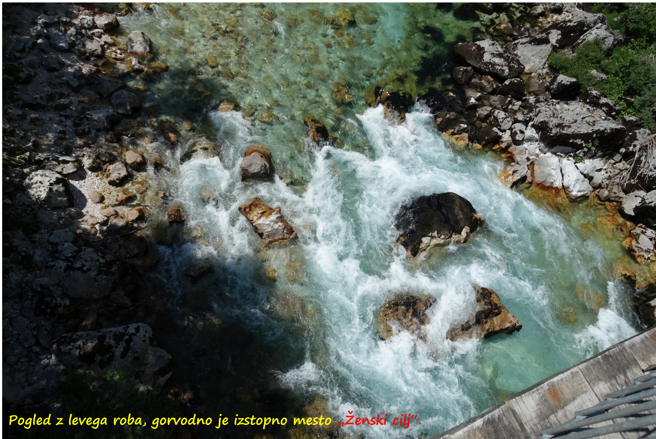
Pogled z levega roba, gorvodno je izstopno mesto „Ženski cilj“.