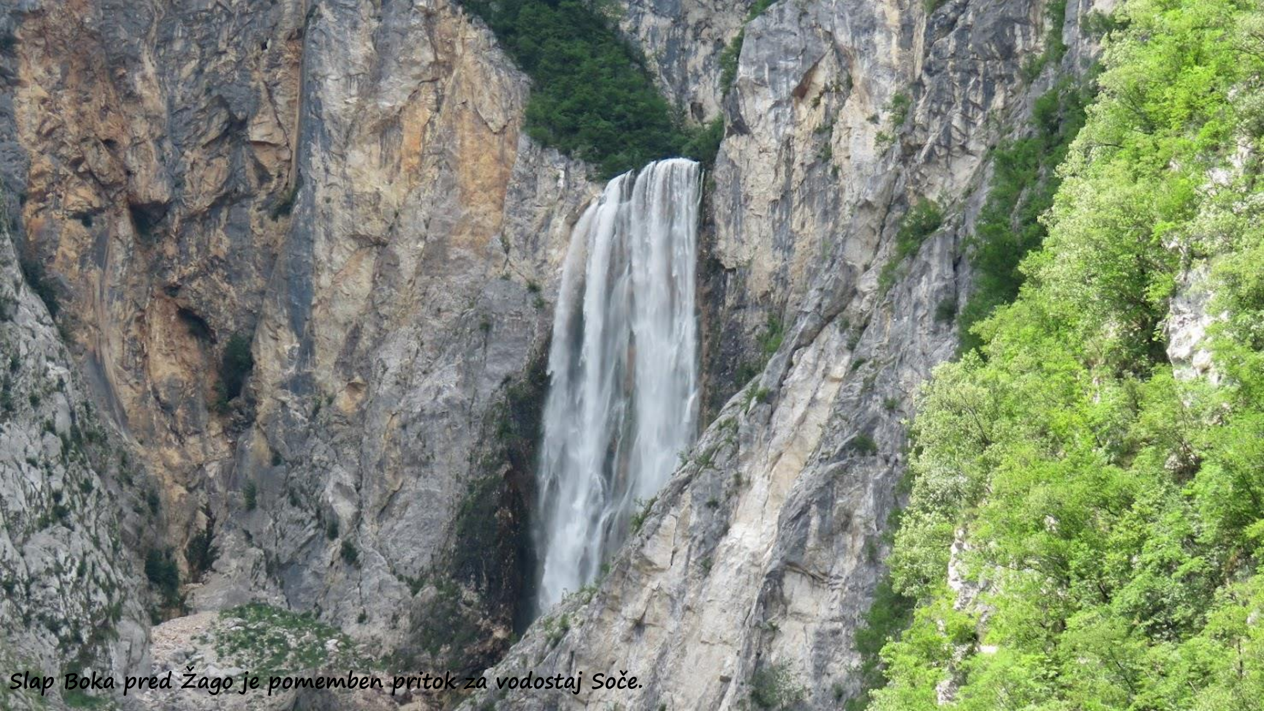
Slap Boka pred Žago je pomemben pritok za vodostaj Soče.