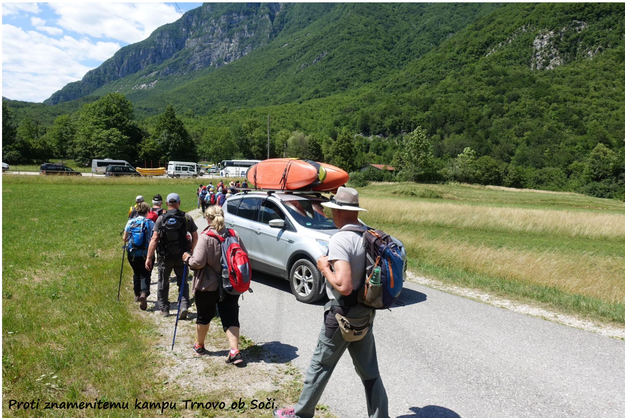
Proti znamenitemu kampu Trnovo ob Soči.